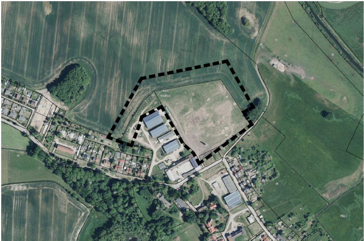
Abb. 2: Luftbild

Das Plangebiet wird derzeit zum Teil als Weidefläche und zum Teil als Ackerfläche genutzt. Das Plangebiet umfasst insgesamt ca. 5,5 ha.