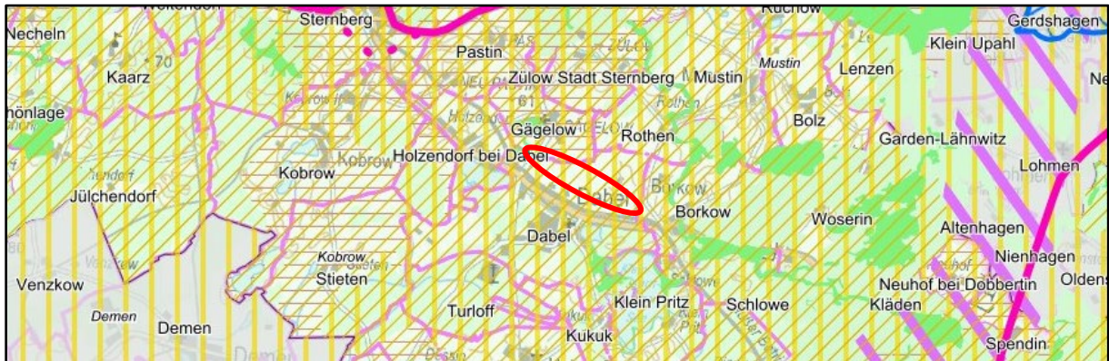
Abbildung 4: Ausschnitt aus dem LEP M-V (Planungsraum rot markiert)

Gemäß der Festlegungskarte des Regionalen Raumentwicklungsprogrammes Westmecklenburg befindet sich der Planungsraum innerhalb eines Tourismusentwicklungsraumes.