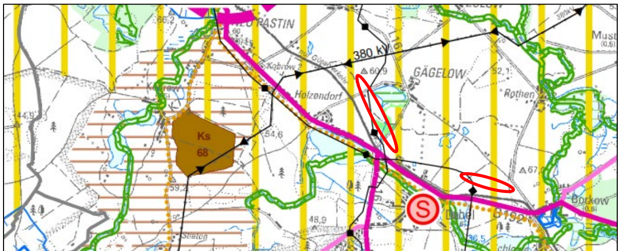
Abbildung 5: Ausschnitt aus dem RREP WM (Planungsraum rot markiert)

Gemäß der Festlegungskarte des Regionalen Raumentwicklungsprogrammes Westmecklenburg befindet sich der Planungsraum innerhalb eines Tourismusentwicklungsraumes.