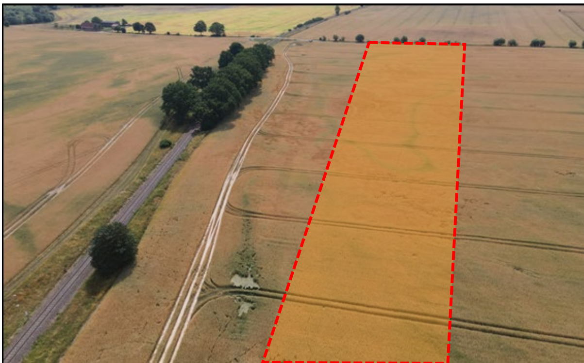
Abbildung 1: Planteil 1; Blickrichtung Südosten (Planungsraum rot skizziert)

Innerhalb des Planteil 1, der sich westlich der Bahntrasse im Norden von Holzendorf und Dabel erstreckt, werden die beiden Baufelder durch die bestehende „Dorfstraße“ voneinander getrennt und durch diese äußerlich erschlossen.