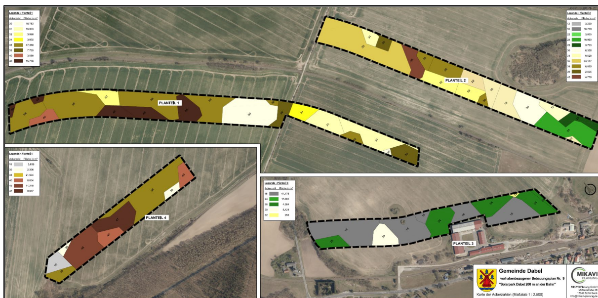
Abbildung 6: Karte der Ackerzahlen