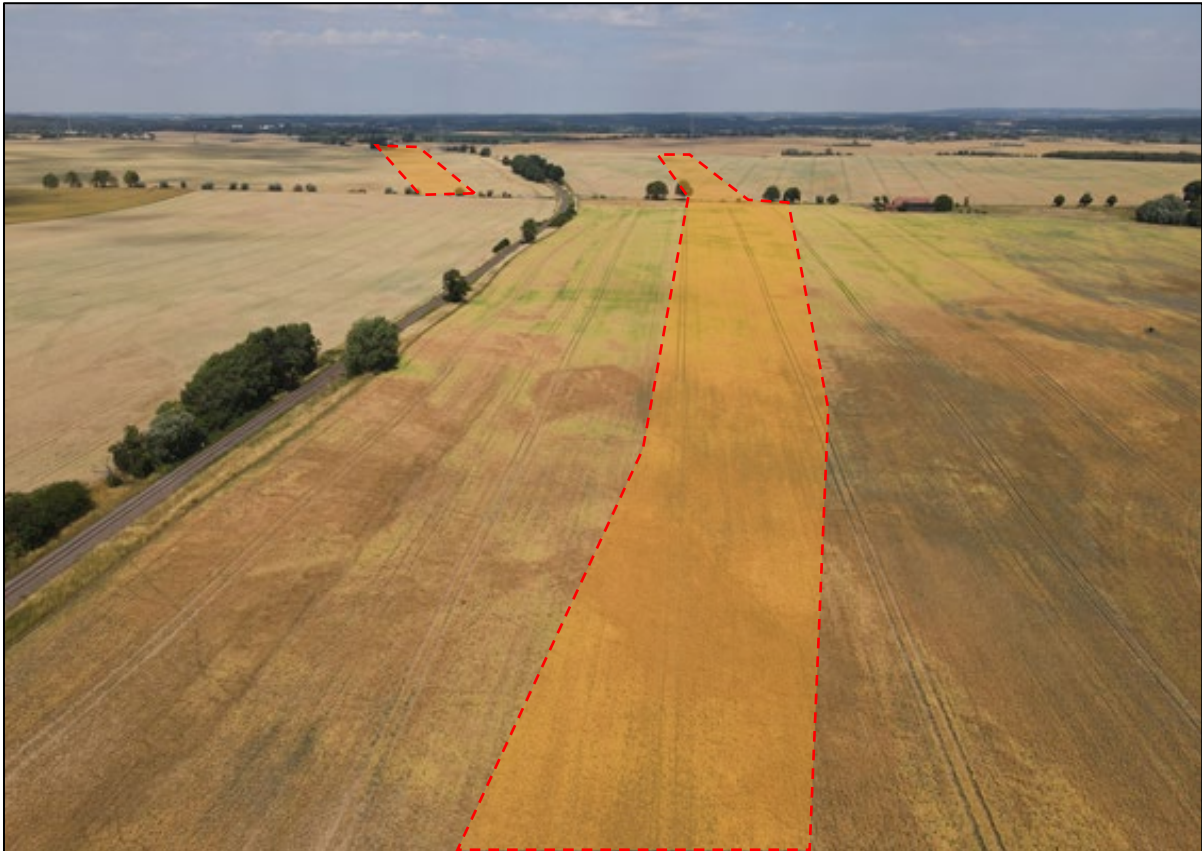
Abbildung 2: Planteil 1 und 2; Blickrichtung Norden (Planungsraum rot skizziert)

Diese öffentliche Straße bildet die nördliche Grenze des Planteil 2 östlich der Bahntrasse, der durch sie ebenfalls äußerlich erschlossen wird.